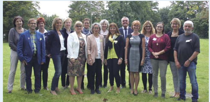
Der Arbeitskreis AIDS / STI Rheinland-Pfalz Nord